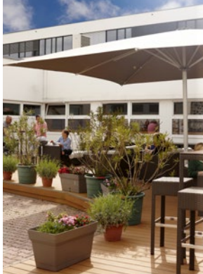
Abb. li.: Sportlounge Abb. unten: Restaurant